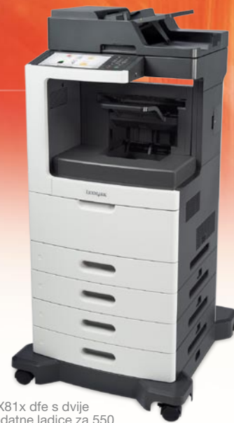
MX81x dfe s dvije dodatne ladice za 550